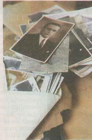
Muziejui perduotos A. M. Brazausko fotografijos

Perduotos Turniškėse buvusios prezidento bibliotekos knygos. Daug kny-