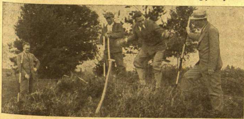
Archeologinė ekspedicija Dovainonių pilkapiuose

Daug liūdnesnis vaizdas yra antruose ir trečiuose Dovainonyse, kur gražūs pilkapiai yra visai sulyginti su žeme. Vidulaukėje teliko nepalieti du pilkapiai, o kiti tegali-