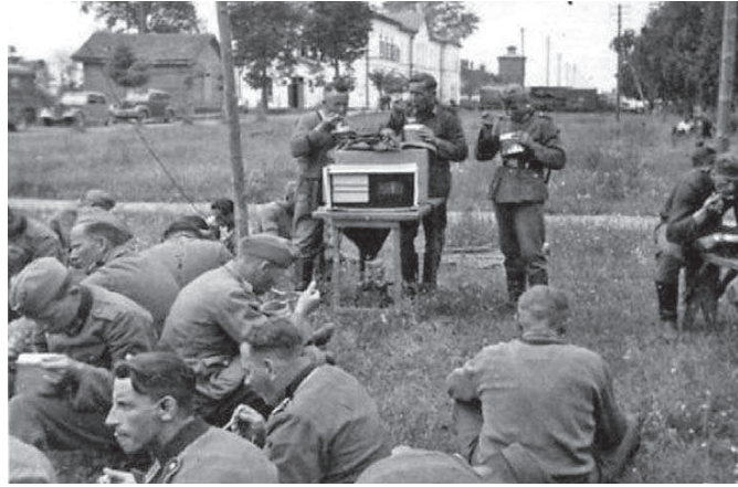
Vokiečių kariai Kaišiadorių geležinkelio stotyje