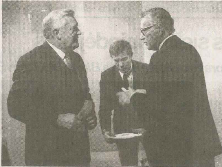
Kandidatų į Prezidentus Algirdo Brazausko ir Stasio Lozoraičio debatai Lietuvos televizijoje. 1993 m.